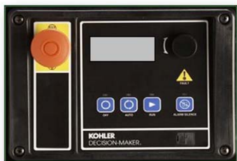
Generator Controls / Decision-Maker® 3000

Электроагрегат, оснащенный пультом Decision-Maker® 3000, обеспечивает качественный контроль, систему отслеживания работы и систему диагностики для оптимизации технических характеристик. Пульт Decision-Maker® 3000 соответствует урону 1 по стандарту NFPA 110, когда он оснащен необходимыми принадлежностями и установлен в соответствии со стандартом NFPA. В пульте Decision-Maker® 3000 используется патентованное программное обеспечение для управления такими сложными системами, как системы регулирования напряжения и тепловой защиты генератора, что обычно требует применения дополнительного оборудования.